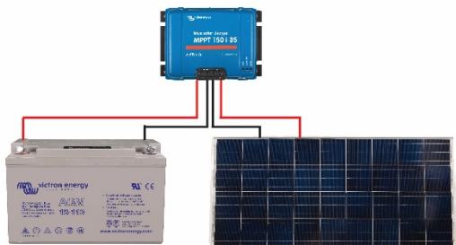
Figura 1: Connessioni elettriche