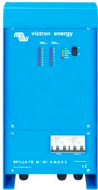
Skylla TG 24 30 GMDSS