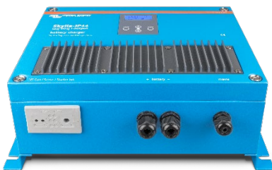
Skylla-IP44 12/60 (1+1)

Per saperne di più sulle batterie e la loro ricarica consultate il nostro manuale " Energia illimitata " (scaricabile gratuitamente dal sito Victron Energy www.victronenergy.com ).