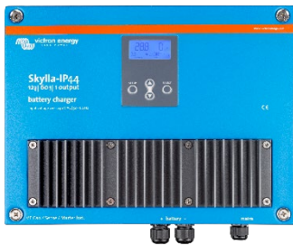
Skylla-IP44 12/60 (1+1)

Lo Skylla-IP44 (3) dispone di 3 uscite isolate. Ogni uscita può fornire la massima corrente di uscita nominale.