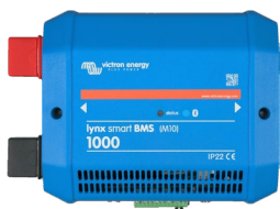
Lynx Smart BMS 1000A