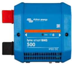
Lynx Smart BMS 500 A