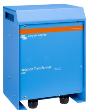
Trasformatore di isolamento 3600W