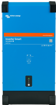
Inverter Smart 12/3000