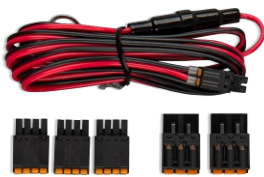
Accessori in dotazione con il GlobalLink 520.