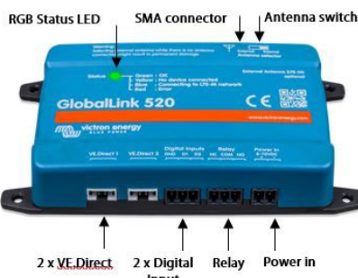
2 x VE.Direct, 2 x Digital Input, Relay, Power in