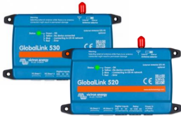
GlobalLink 530 e 520