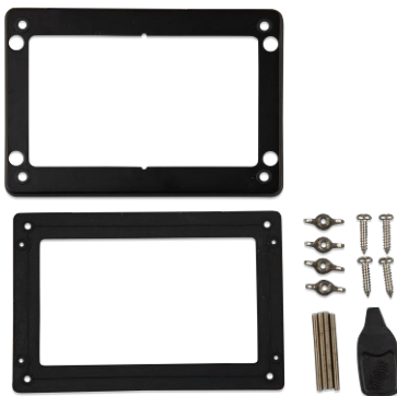
Accessori in dotazione con il GX Touch 50