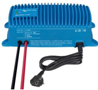
Caricabatterie Blue Smart IP67 12/25