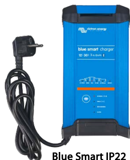
Blue Smart IP22 12/30 (3)