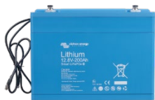
Batterie Lithium Battery Smart da 12,8 V e 25,6 V