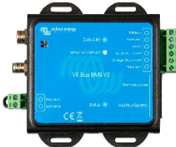
VE.Bus BMS V2