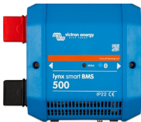
Lynx Smart BMS 500 A