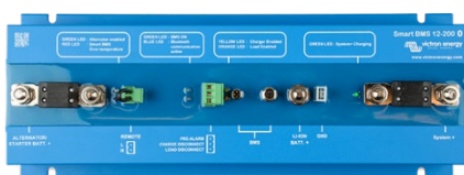
Smart BMS 12/200