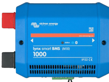
Lynx Smart BMS 1000A