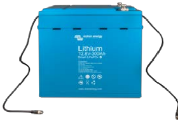
Batteria LiFePO 4 12,8V 300Ah

È molto utile per identificare un (possibile) problema, come uno squilibrio della cella.